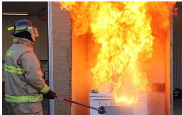
L'effet d'un simple verre d'eau....

La Régie Intermunicipale de Sécurité Incendie de Bulstrode