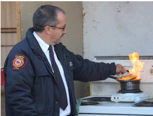
Remettre le couvercle et fermer le rond.

Les vêtements, surtout synthétiques, brûlent rapidement. Si vos vêtements prennent feu, jetez-vous par terre et roulez en vous couvrant le visage. Cette action simple et efficace permet d'étouffer le feu. Informez vos enfants et vos proches, en particulier les personnes âgées, de ce conseil.