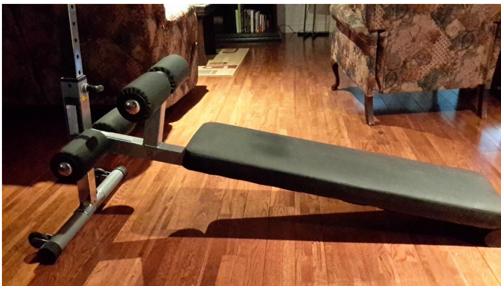
Planche pour les abdominaux 60 $