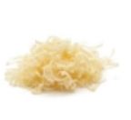
Mozzarella râpée 375 ml (1 1/2 tasse)

Qu'est-ce qui nous fait craquer dans cette pizza facile à préparer au poulet? La saveur sucrée-salée procurée par la sauce au miel et pesto. C'est bon à s'en lécher les doigts!