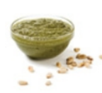
Pesto 45 ml (3 c. à soupe)