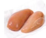
Poitrine de poulet 1, sans peau cuite et coupée en dés